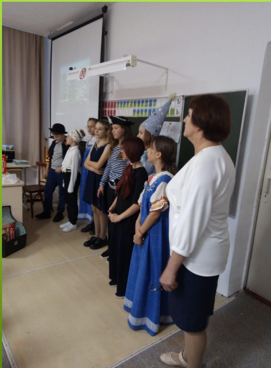
Поведение итогов. Вручение сладостей из сундука.