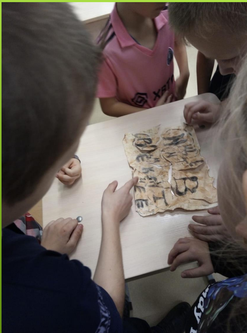
Этап «Пиратский остров»