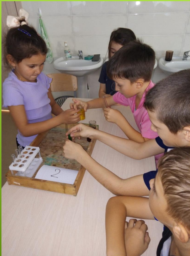
Этап «В гостях у феи Валери»